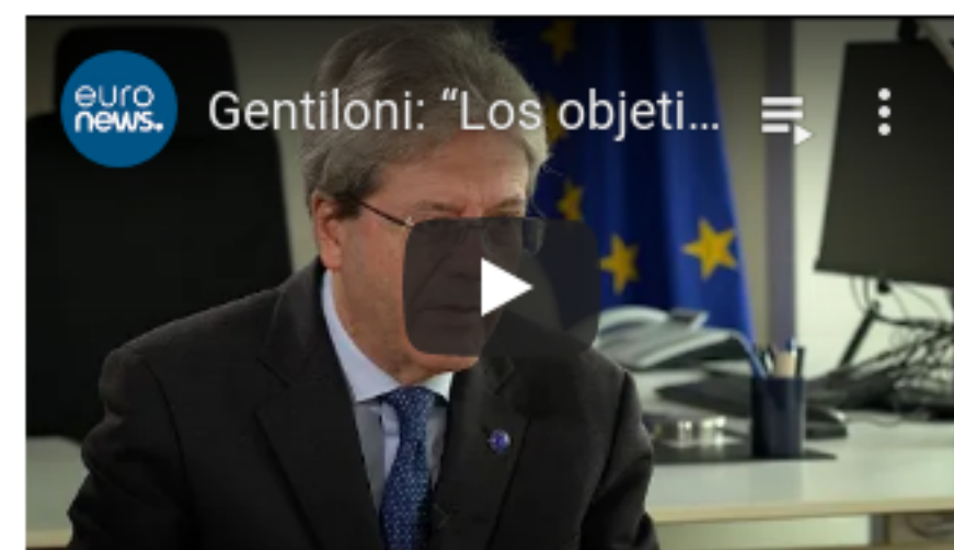
Vídeo noticias por cortesía de agencia RoiPress